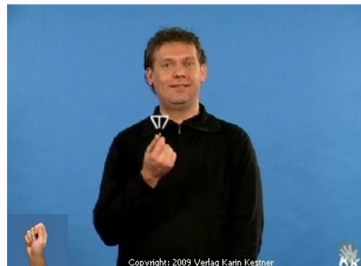
Pfennig / Geld